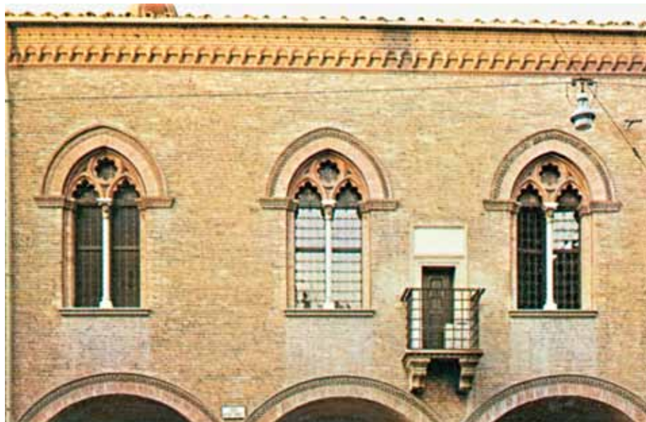
Frem til sommeren 1411 holdt kurien for den anden modpave valgt i Pisa til i Bologna. At kurien lige opholdt sig dér kan have mange årsager, men i juridisk henseende var det yderst praktisk, da Bologna husede det førende universitet for jurastudier i middelalderen. Del af facaden på de middelalderlige universitetsbygninger i Bologna. Gengivet efter Henning Dehn-Nielsen (red.): "Lademanns Verdenshistorie – Historie og Kultur, bd. 2 Middelalderen"